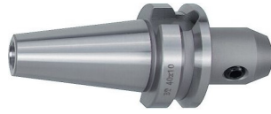
Spannfutter Weldon gewuchtet G6,3 15.000 U/min