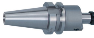
Messerkopf-Aufnahme nach DIN6357