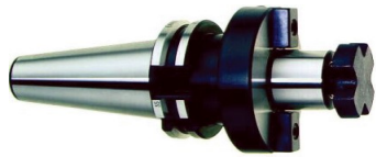
Messerkopf-Aufnahme nach DIN6357