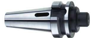
Einsatzhülsen für MK mit Lappen