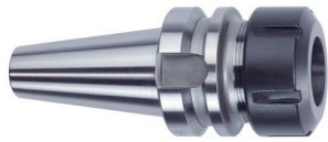
Spannzangenfutter ER gewuchtet G6,3 15.000 U/min